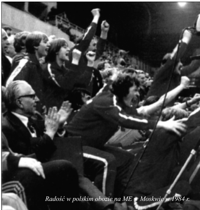
Radość w polskim obozie na ME w Moskwie w 1984 r.