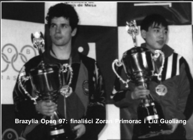
Brazyli Open 97: finaliści Zoran Primorac i Liu Guoliang

Po wydarzeniach związanych z wojenną zawieruchą Zoran Primorac gra dla swej nowej ojczyzny, pnąc się w górę w światowym rankingu. Występuje obecnie na co dzień w belgijskim „Charleroi”, bierze też udział w wielu imprezach światowego formatu. Największy sukces w grze pojedynczej osiągnął w ME w Stuttgarcie, gdzie po pokonaniu w ćwierćfinale 3:2 Jana Ove-Waldnera przegrał 2:3 po dramatycznej walce w półfinale z późniejszym mistrzem Europy Jorgiem Rosskopfem. Ostatnie wyniki w Brazyli Open, European Masters Cup i China Open świadczą o chęci powtórzenia wyników deblowych tym razem w grze pojedynczej.